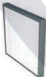
FILTRO DE FIBRA F9