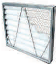
FILTRO DE MANTA SUPERFICIE QUEBRADA

Al igual que en las campanas industriales, nuestros equipos de filtración llevan en su interior una clase de filtros para un óptimo rendimiento.