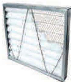
FILTRO DE MANTA SUPERFICIE QUEBRADA

Al igual que en las campanas industriales, nuestros equipos de filtración llevan en su interior una clase de filtros para un óptimo rendimiento.