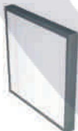
FILTRO DE FIBRA F9