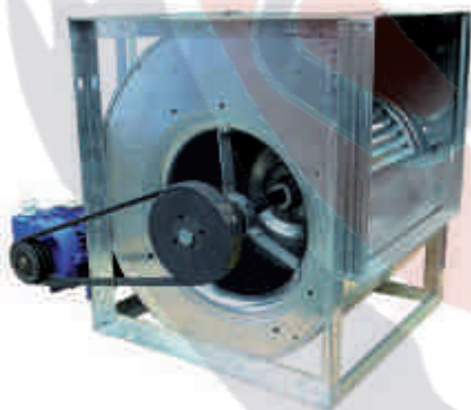
Foto: Motor en posición B